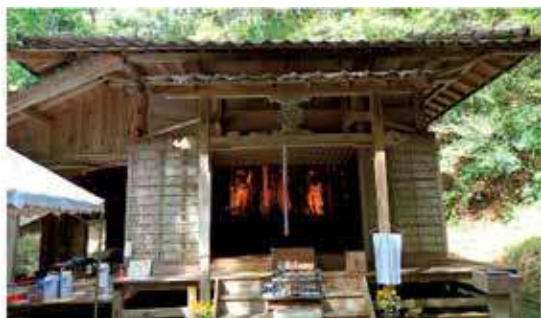
開帳時の中山観音堂

このお堂は、地元の住民の方が管理されており、普段は施錠されているので拝観することはできませんでした。