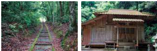
中山観音堂への参道

中山観音堂は、国道219号線で多良木町に入り、県道48号多良木相良線を通して山間に向かったところにあります。