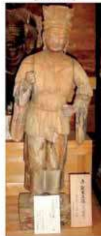
帝釈天 (ダイシャクテン)

康平寺の帝釈天像は、綺麗な顔立ちをされていました。弘法大師の影響があったのでしょうか。