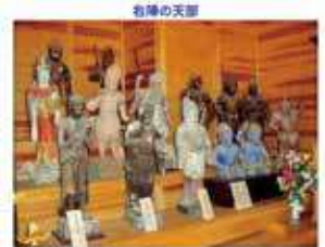
千手観音に従う二十八部衆