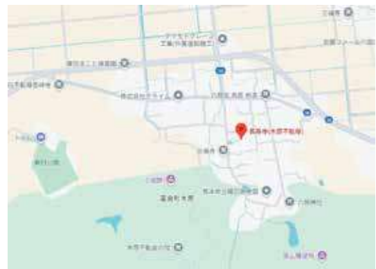
木原不動尊は、雁回山の麓にありました。