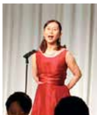
小野ソングリーダー