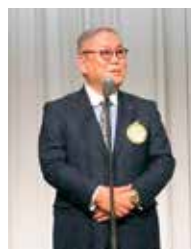
閉会の辞 立石会長エレクト