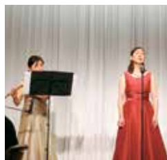
ソングリーダーと フルーツ